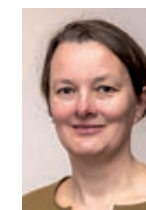
Eine segensreiche Passions- und Osterzeit wünscht

Der NazarethBrief hätte gut und gerne den doppelten Umfang haben können und hätte sicher noch immer nicht alle Momente benannt, die uns traurig sein oder die uns trauern lassen. Mit den zusammengestellten Texten wollen wir aber einladen, sich mit der eigenen Trauer zu befassen, sich Gedanken um das Abschiednehmen und den Tod zu machen – und um das Leben. Denn beides braucht Raum und ist wertvoll. Und wir laden ein, die Trauer mit in die Gemeinschaft zu nehmen. Wer das schon einmal gewagt hat, weiß um die Überwindung, die das kostet, weiß aber vermutlich auch um den Wert, der im gemeinschaftlichen Trauern, im Weinen und Lachen, im Schweigen und Reden, im Gehen und Stehen, im Singen und Beten, im Erinnern und Weitergehen liegt. Trauerkultur in Nazareth ist nichts Statisches, und auch wenn manche Abläufe sehr klar und definiert sind, bleibt Kultur in Nazareth wandelbar und lebt aus dem, was wir alle dazu beisteuern.